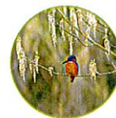
Le martin pêcheur