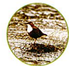
Le cincle plongeur