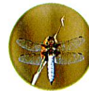
La libellule déprimée